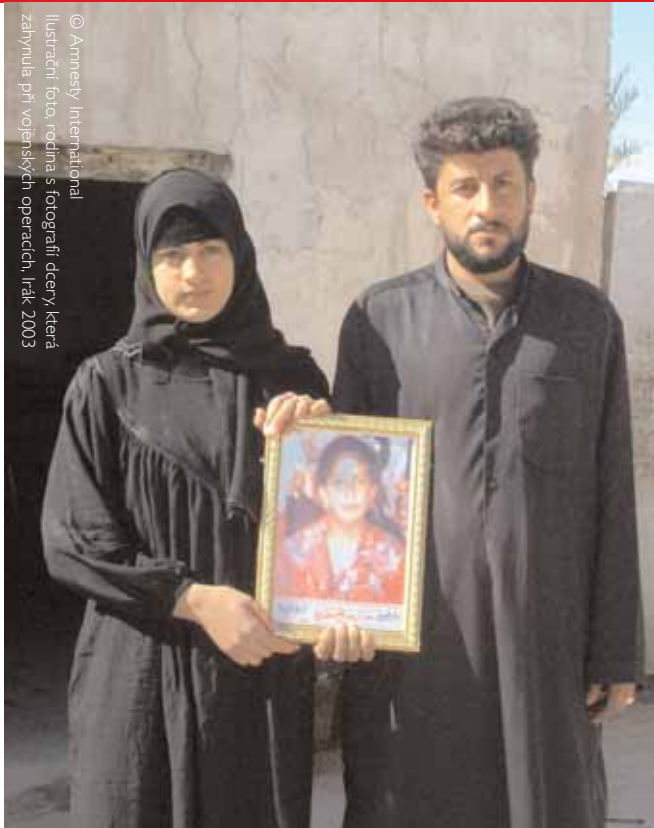
Ilustrační foto, rodina s fotografií dceři, která zahynula při vojenských operacích, Irák, 2003