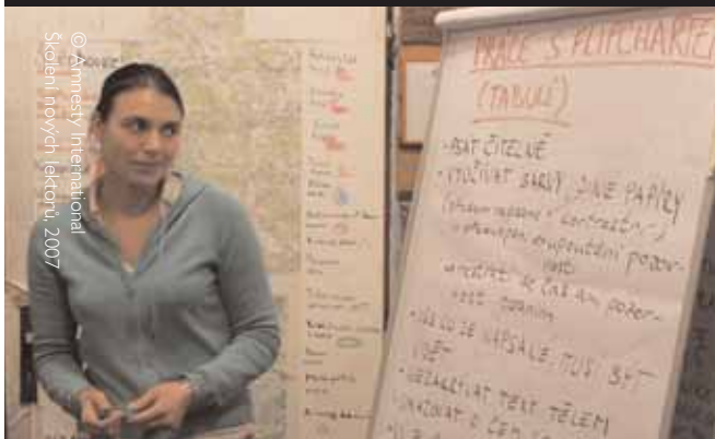
Školení nových lektorů, 2007

V prvním březnovém víkendu proběhlo setkání zájemců o vzdělávání k lidským právům. Víkendový program hostila skautská klubovna v pražské čtvrti Kamýk.